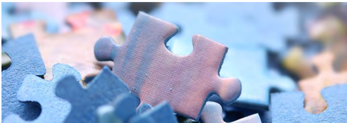
Csr Campania 23-27: le schede degli interventi