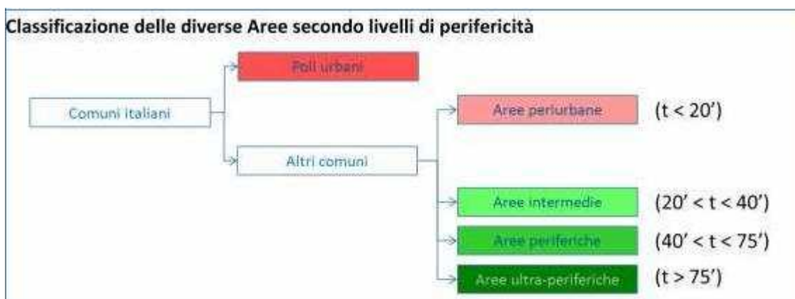
Figura 2.App: Aree interne: classificazione delle diverse aree