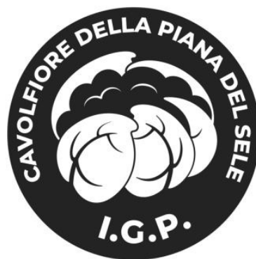
Versione bianco e nero negativo

Il marchio consiste nella rappresentazione di un cavolfiore bianco avvolto dalle sue foglie verdi (C 49 M 9 Y92 K0), in stile cartoon, su uno sfondo marrone sfumato (C 5 M 64 Y100 K0), che richiama cromaticamente la terra.