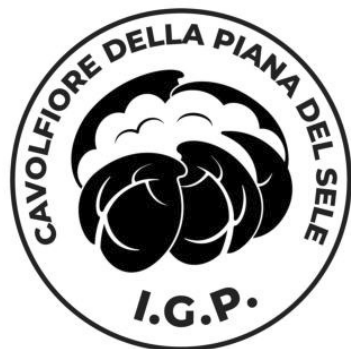
Versione bianco e nero positivo