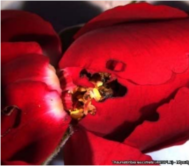
Haemaphysalis laucotteta (RCP) - 10/20/10