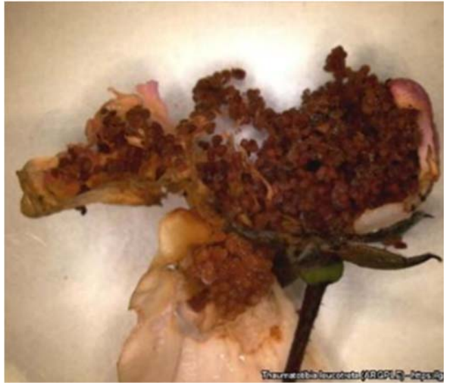
Haemaphysalis laucotteta (RCP) - 10/20/10