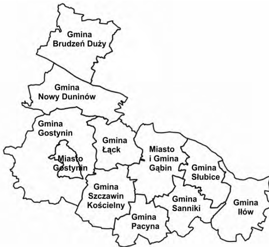
Area coperta dalle attività del GAL Aktywni Razem

Il GAL AKTYWNI RAZEM ha competenza su un'area che copre 11 comuni del nord-ovest della Mazovia: Brudzeń Duży, Gabin, Gostynin (rurale), città di Gostynin, Iłow, Łack, Nowy Duninów, Pacyna, Sanniki, Słubice, Szczawin Kościelny. Essi comprendono 2 città: Gostynin e Gabin. L'area appartiene a 3 contee (Powiat): Plock, Gostynin e Sochaczew.