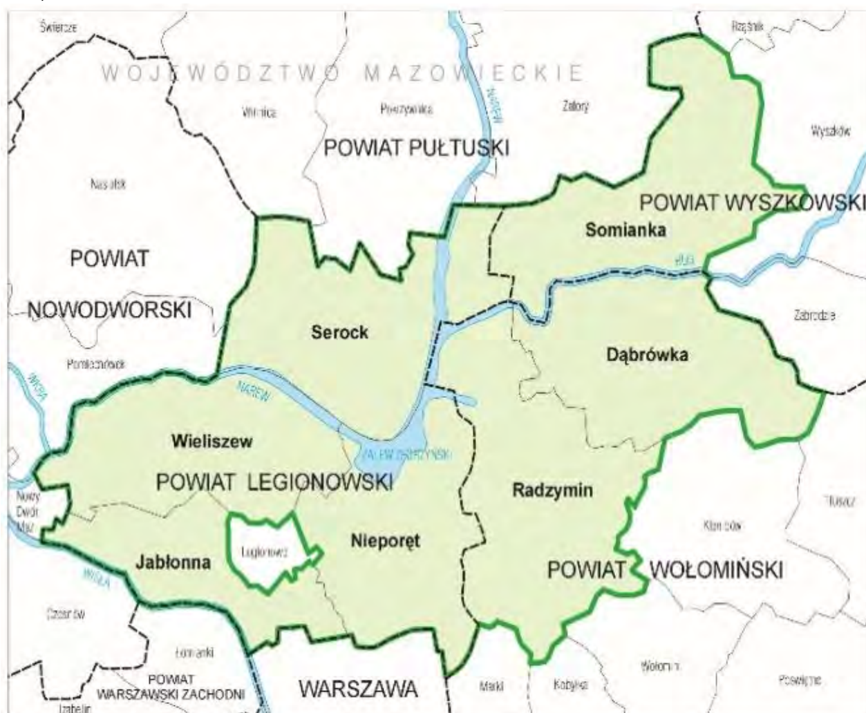
Area coperta dalle attività del GAL Zalew Zegrzynski(Capofila)

Le attività del GAL Zalew Zegrzynski coprono un'area nel centro della Regione Mazovia, confinante con la capitale della Polonia, Varsavia. La superficie di questa zona è 733 km 2 . Sono 7 i comuni che fanno parte di quest'area: Jablonna, Nieporęt, Serock, Wieliszew (tutti appartenenti alla Legionowo County), Dąbrowka, Radzymin (appartenenti a Wołomin County) e Somianka (appartenente al Wyszki County). Ci sono 2 città nella zona dei GAL: Radzymin e Serock. La popolazione della zona del GAL Zalew Zegrzynski è di 94,729.